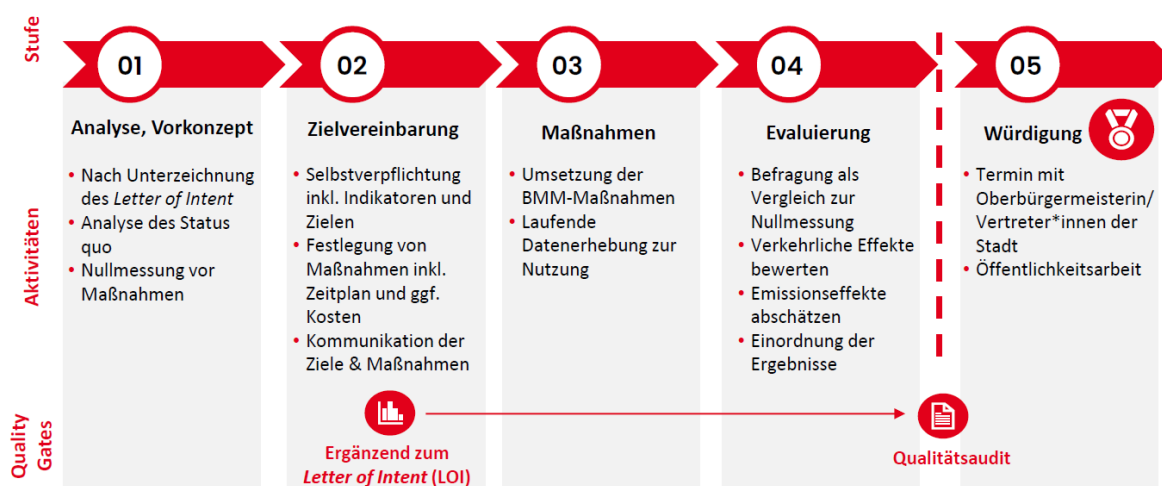
Abbildung 1: Prozessschritte im Programm clever mobil

Die Evaluierung umfasst die umgesetzten Maßnahmen, die durch die Arbeitgebenden selbst gesetzt werden, die Verhaltensänderungen im Mobilitätsverhalten der Mitarbeitenden und die dadurch erzielten Emissionseffekte. Diese Effekte werden auch in gängigen Nachhaltigkeitsberichterstattungen abgefragt.