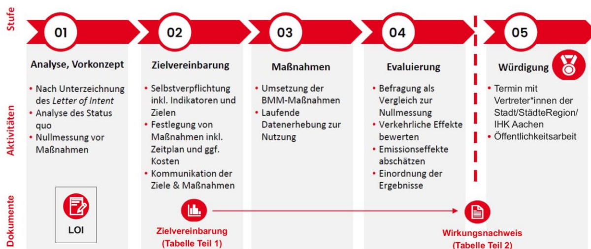
Abbildung 1: Prozessschritte im Programm clever mobil

Die Evaluierung umfasst die umgesetzten Maßnahmen, die durch die Arbeitgebenden selbst gesetzt werden, die Verhaltensänderungen im Mobilitätsverhalten der Mitarbeitenden und die dadurch erzielten Emissionseffekte. Diese Effekte werden auch in gängigen Nachhaltigkeitsberichterstattungen abgefragt.